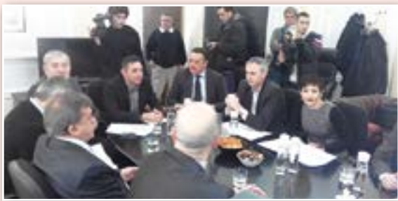
Министри рада и енергетике и директор НСЗ у посети Костолацу

Бесповратна средства за samozapošljavanje у опреми додељују се за највише 50 незапослених особа ромске националности са најбољим бизнис плановима, наводи се у саопштењу Градског центра за предузетништво. Средства су намењена незапосленима са успешно завршеном обуком о начелима вођења сопственог бизниса, у организацији Градског центра за социјално предузетништво, а корисници су у обавези да обављају регистровану делатност најмање годину дана.