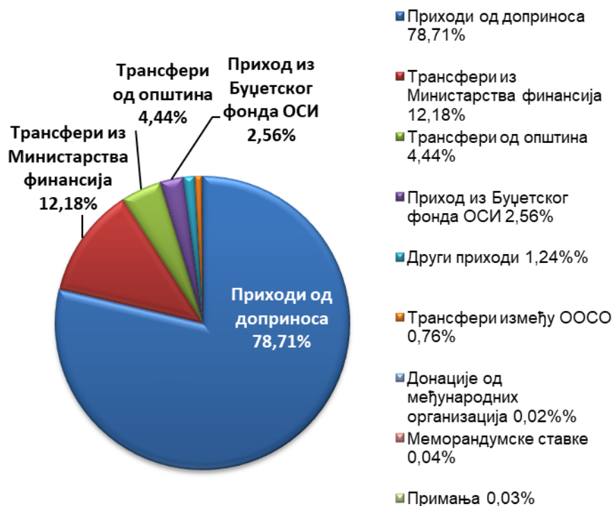
Графикон - Структура прихода и примања НСЗ у периоду 01.01.-31.12.2020.

Примања од продаје основних средстава остварена су у износу од 9.722.969,71 динара, а примања од продаје финансијске имовине остварена су у износу од 3.121.882,13 динара.