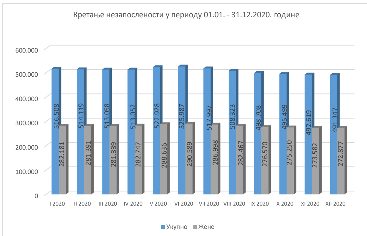
Графикон 1 – Кретање незапослености у 2020. години

У току извештајног периода, у периоду јануар - април број незапослених лица бележи благи пад, а затим се лагано расте током маја и достиже свој максимум у јуну 2020. године, када је број незапослених лица на евиденцији